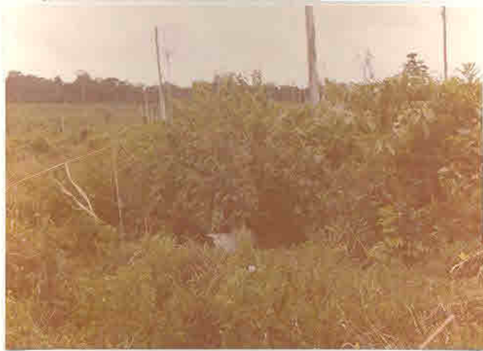
Fig. 3.2 - Aspecto da juçuíra na Cia. Agropecuária do Pará (SWIFT).