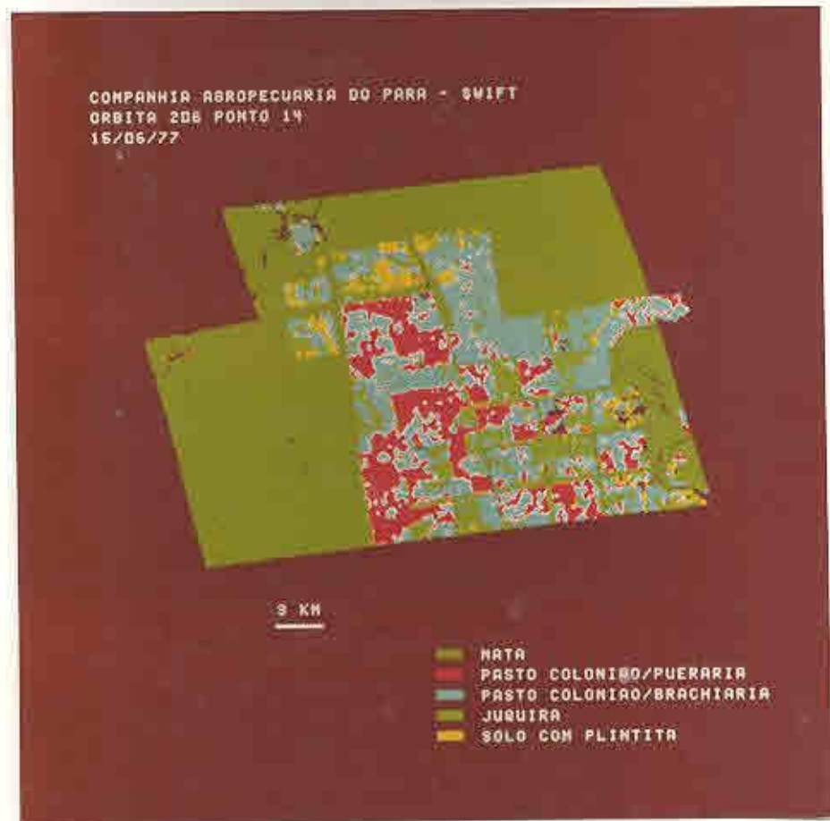
Fig. 3.4 - Classificação automática das classes de pastagens para a Cia. Agropecuária do Pará (SWIFT).

A Figura 3.4 apresenta os resultados da classificação automática para a Cia. Agropecuária do Pará (SWIFT).