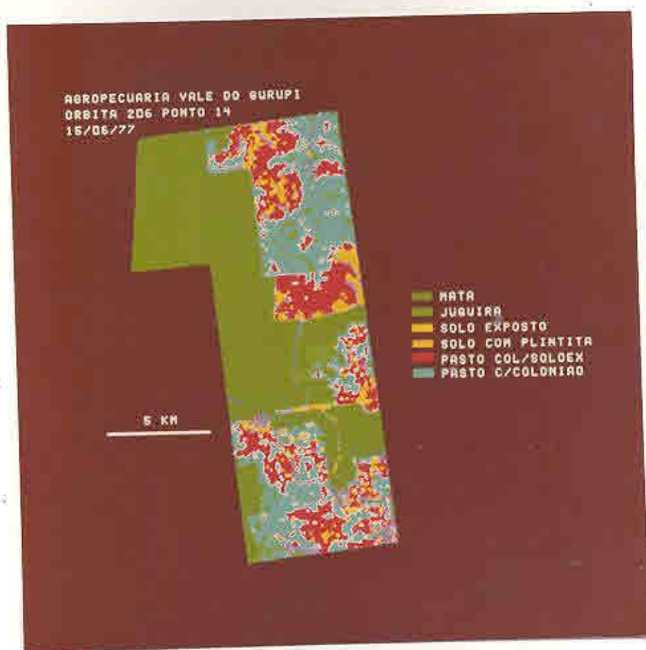
Fig. 3.1 - Classificação automática das classes de pastagens para a Pastoral Agrícola Vale do Gurupi.

A Figura 3.1 apresenta o resultado da classificação automática da Pastoral Agrícola Vale do Gurupi.